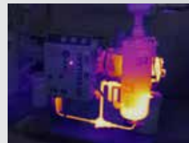
75 % 混合